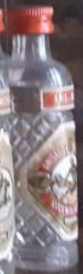
El Anís del Mono es una bebida tradicional de Badalona.